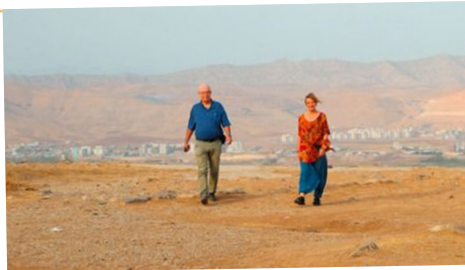
Eine Brücke nach Rojava

>> www.fern-welt-nah.de/einebrueckenachrojava