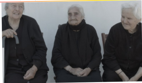
Eingebrannt - Frauen auf Kreta

Dienstag, 26. September, 19 Uhr | Haus am Dom Film, Gespräch & Diskussion Mit Barbara Englert. Host: Dritte Welt Haus Frankfurt e.V.