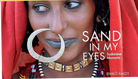
© Sand in my eyes - sudanese moments, Enikő Nagy

Sprichworte, Gedichte, Fabeln und Anekdoten zeigen wie Menschen im Sudan denken, fühlen und nach ihrer Zukunft suchen. Das gleichnamige Buch, für das die Autorin und Fotografin in vielen Jahren im Sudan Momente des täglichen Lebens bei 45 ethnischen Gruppen und nach 30 000 zurückgelegten Kilometern dokumentiert hat, ermöglicht eine Begegnung auf Augenhöhe und leistet kulturellen Widerstand. Nach dem Film präsentieren Shadia Abdelmoneim und Enikő Nagy in einer bebilderten, atmosphärischen Präsentation Auszüge aus dem Buch „Sudanese Moments“ (auf arabisch mit deutscher Übersetzung), dessen gleichnamige Wanderausstellung bisher über 50 000 Besucher begeistert hat. Anschließend gibt es zudem eine Dattelerkostung. >> www.fern-welt-nah.de/sandinmyeyes